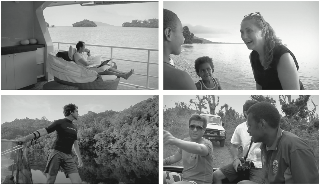
Abb. 2, 3, 4 u. 5: TBA21, The Current [Promotion Video]; Quelle: https://www.tba21.org/#item--the_current--1157

bestimmten Politik werden zu lassen. 80 Beide sind somit untrennbar miteinander verbunden, wie die Beispiele Galloways instruktiv belegen: Während es in einer politischen Forderung etwa um die Anerkennung von Frauen im Arbeitsleben oder um Tierrechte gehe, würde eine ethische Forderung immer um die Auflösung von Aufteilungen bemüht sein, z.B. die Infragestellung fester Zuschreibungen zur Kategorie ›Frau‹ oder das Bestreben, jeden Speziesismus zu überwinden. 81