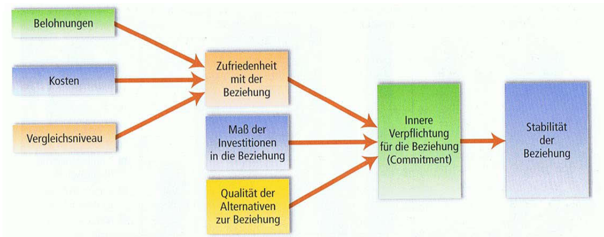
Abb. 1: Das Investitionsmodell von Rusbult (In: Aronson, E. et al., 2008, S. 339).